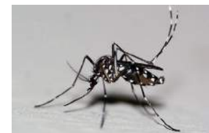
Moustique tigre Info

Il est également possible de signaler la présence du Moustique tigre afin de participer à sa prise en compte et de suivre son évolution sur le territoire : via l'application i Moustique® sur smartphone (sur Android et iOS), en remplissant un formulaire en ligne sur le site de l'EID ou en envoyant des spécimens capturés à l'EID.